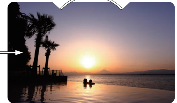
うわあ、きれい。屋外スパから眺めるサンセット 江の島アイランドスパ

江の島エリアで唯一の天然温泉が楽しめるのが、江の島アイランドスパ。屋外スパから眺めるサンセットは絶景のひと言。夕焼けに照らされる海と富士山のシルエットの美しさに、きっと感動の声がもれるはず。水着着用だからカップルでもOK。タオルや水着の有料レンタルもあるので手ぶらでも。利用料金はシーズンによって変動するので、最新情報はウェブサイトをチェックを。