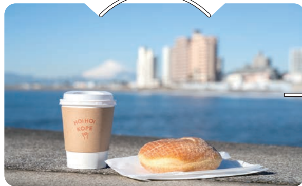
焼き立てパン&コーヒーでビーチモーニング KOMOPAN

食事パンから菓子パンまで種類ごとに国産小麦を13種ブレンドして作られるパンはどれも風味豊か。ハワイを舞台にした映画『ホノカアボーイ』にインスパイアされた店内は海帰りのサーファーなど地元の方でいつも賑わっている。店から歩いてすぐのビーチで地元鎌倉『ザグッドグッディーズ』のコーヒー(486円)にアメリカンサイズのマラサダ(162円)をばおれば、素敵な1日がスタートしそう!