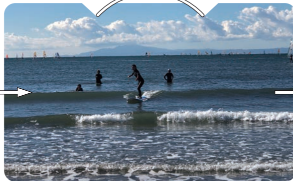
ビギナーも経験者も、ロコ気分でサーフィン T-REEF SURF & SUP SCHOOL

湘南で憧れの波乗りデビューをしたい! そんな方におすすめしたいのが、Blue Lagoonのホストで地元でも屈指のサーファーである富永忠男が主宰する T-REEF SURF & SUP SCHOOL 。富永とその仲間が、ビギナーから経験者までプライベートでレッスン。鎌倉の波を知り尽くしているので、その時にベストなコンディションのスポットをチョイスして、安全、楽しく手ほどきをしてくれる。