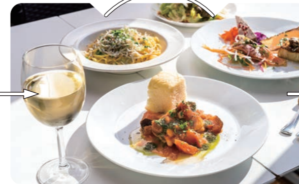
海を感じながら、絶品イタリアンとワインを Siciliana

七里ガ浜沿いの2階に位置する店内からは青く広がる海の絶景が。時間ごとに移りゆく景色を眺めながらいただくのは地元食材を盛り込んだイタリアン。破格となるランチコース(1,880円)は前菜・パスタ・メインがついてボリュームもたっぷり大人気。他にもワインとともにゆっくり味わいたい料理がそろそろ。12年目となる店には、シチリアのトラットリアのような陽気な笑いがあふれている。